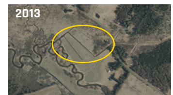
Cours d'eau d'origine naturel selon les photographies aériennes